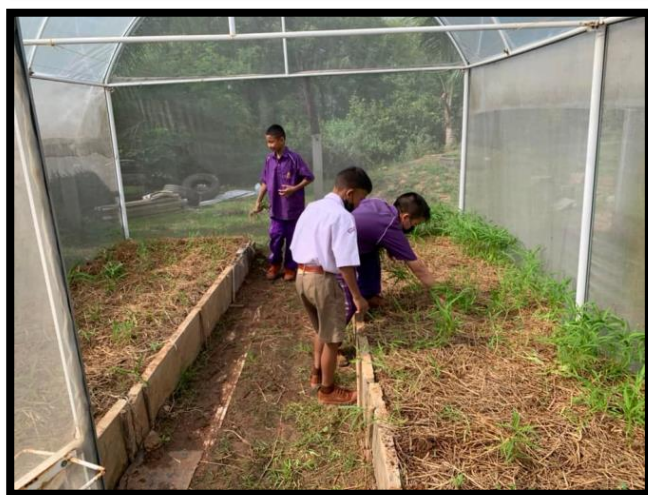
การปลูกผักปลอดสารพิษในศูนย์เศรษฐกิจพอเพียง ป.๔ - ม.๓