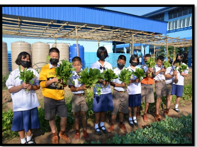
ผลผลิตและผลิตภัณฑ์ในการฝึกพัฒนาทักษะอาชีพ ป.๔ - ม.๓