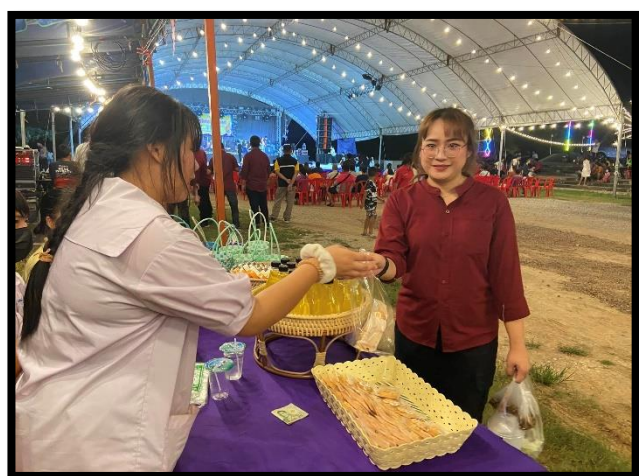
การฝึกอาชีพและการหารายได้เสริม