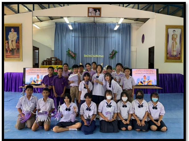
การฝึกทักษะอาชีพ การจักสาน ป.๔ - ม.๓