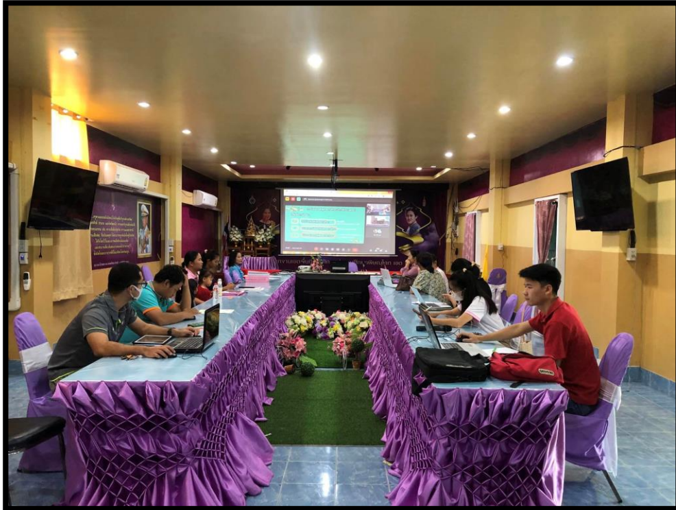
ประชุมชี้แจงแนวทางในการดำเนินงานโครงการส่งเสริมการเรียนรู้และพัฒนาทักษะอาชีพ