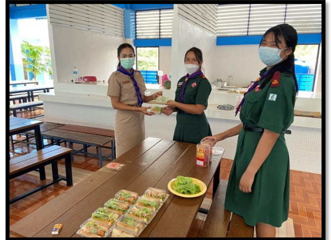
ทำแซนด์วิชห่มผ้า และนำไปขาย ม.๑- ม.๓