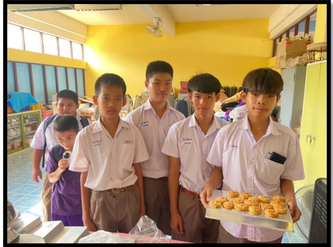
ทำคุกกี้เนย ป.๔ - ม.๓