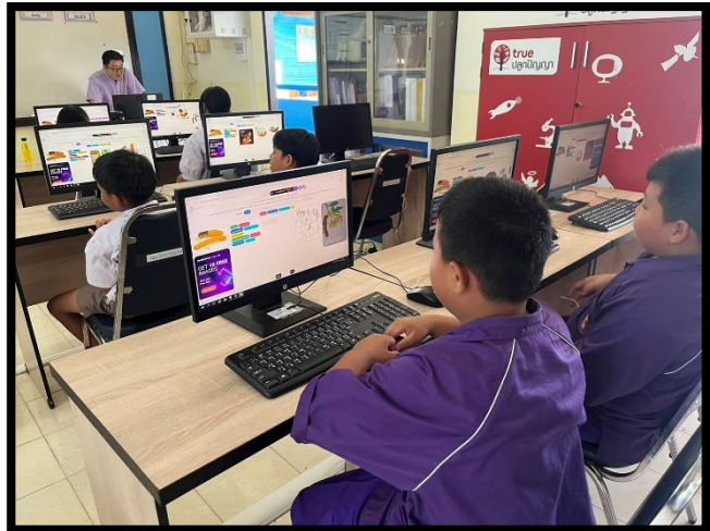
การฝึกพัฒนาทักษะอาชีพ ในการออกแบบป้ายติดผลิตภัณฑ์ ป.๔ - ม.๓